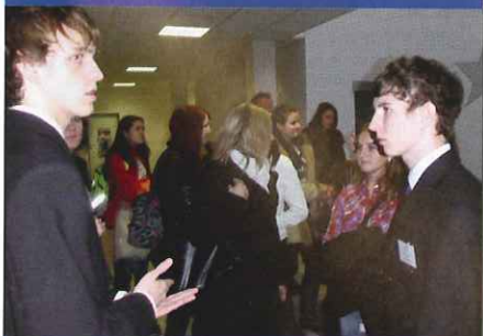
Den otevřených dveří v SOŠ pro administrativu EU